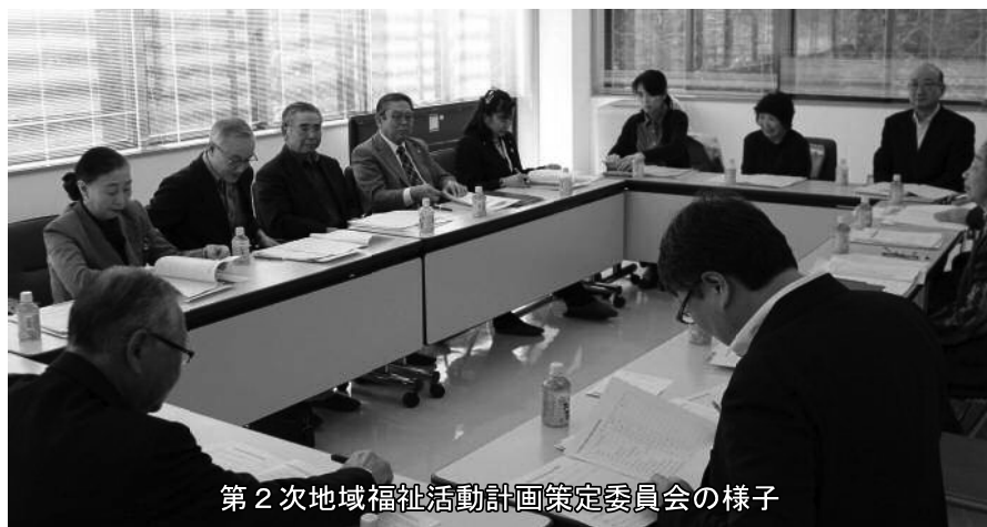
第2次地域福祉活動計画策定委員会の様子

本年も皆様にとって良い年にな るよう、役職員一丸となって 深浦町の地域福祉向上に努力し ていく所存ですので、今後もお 力添えを賜りますようお願い申 し上げ、新年にあたってのご挨拶 とさせていただきます。