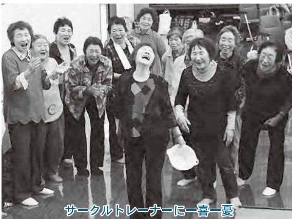
サークルトレナーに一喜一憂

生きがい活動支援事業は、毎週各地区で実施(地区ごとに曜日は違います)していますので、お気軽にお立ち寄りください。