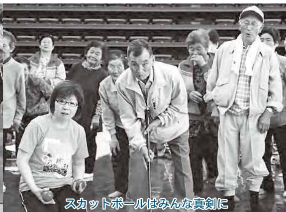
スカットボールはみんな真剣に