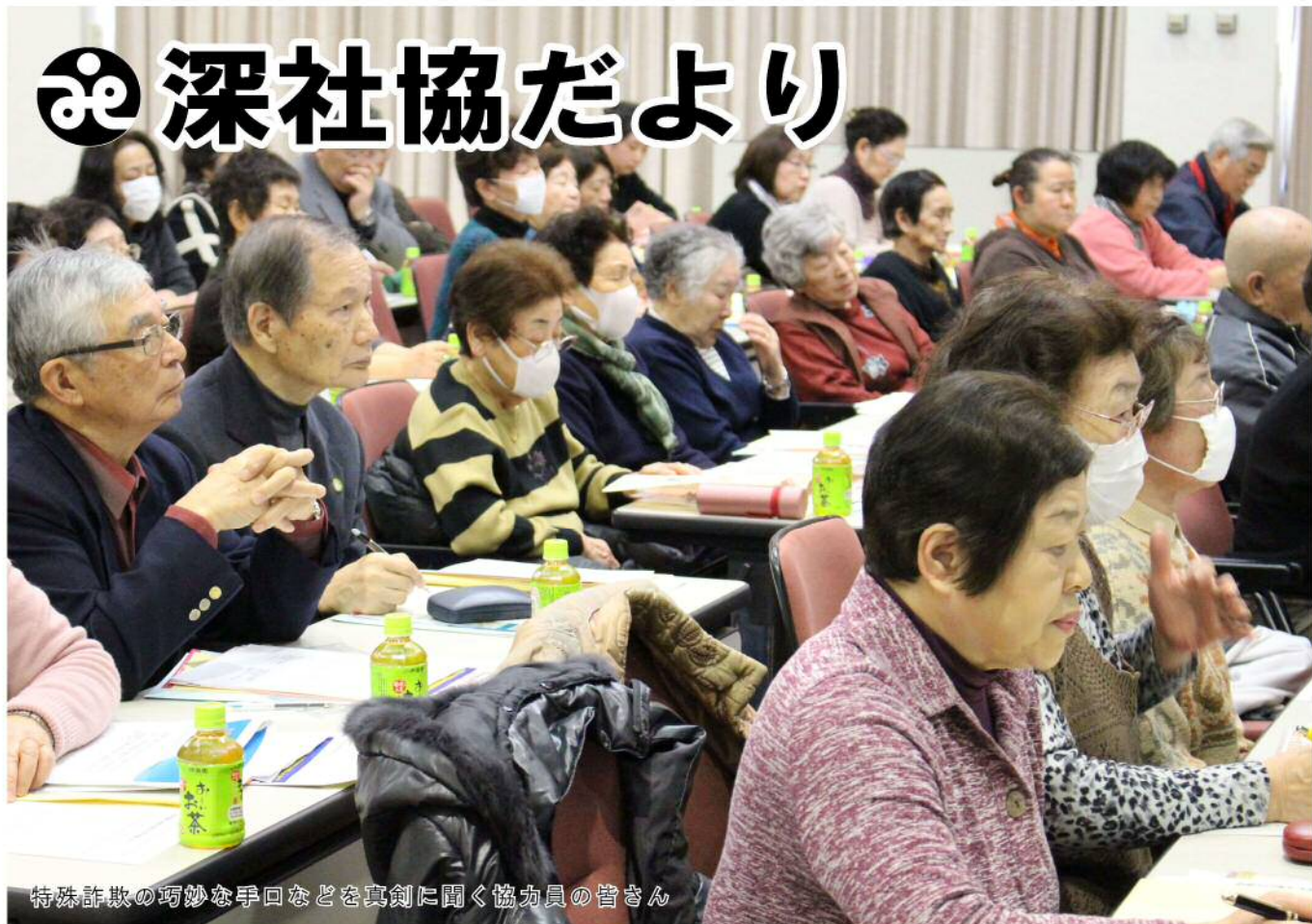
特殊詐欺の巧妙な手口などを真剣に聞く協力員の皆さん

「ほのぼのの交流事業協力員研修会を開催」 「特殊詐欺の被害」について勉強しました！