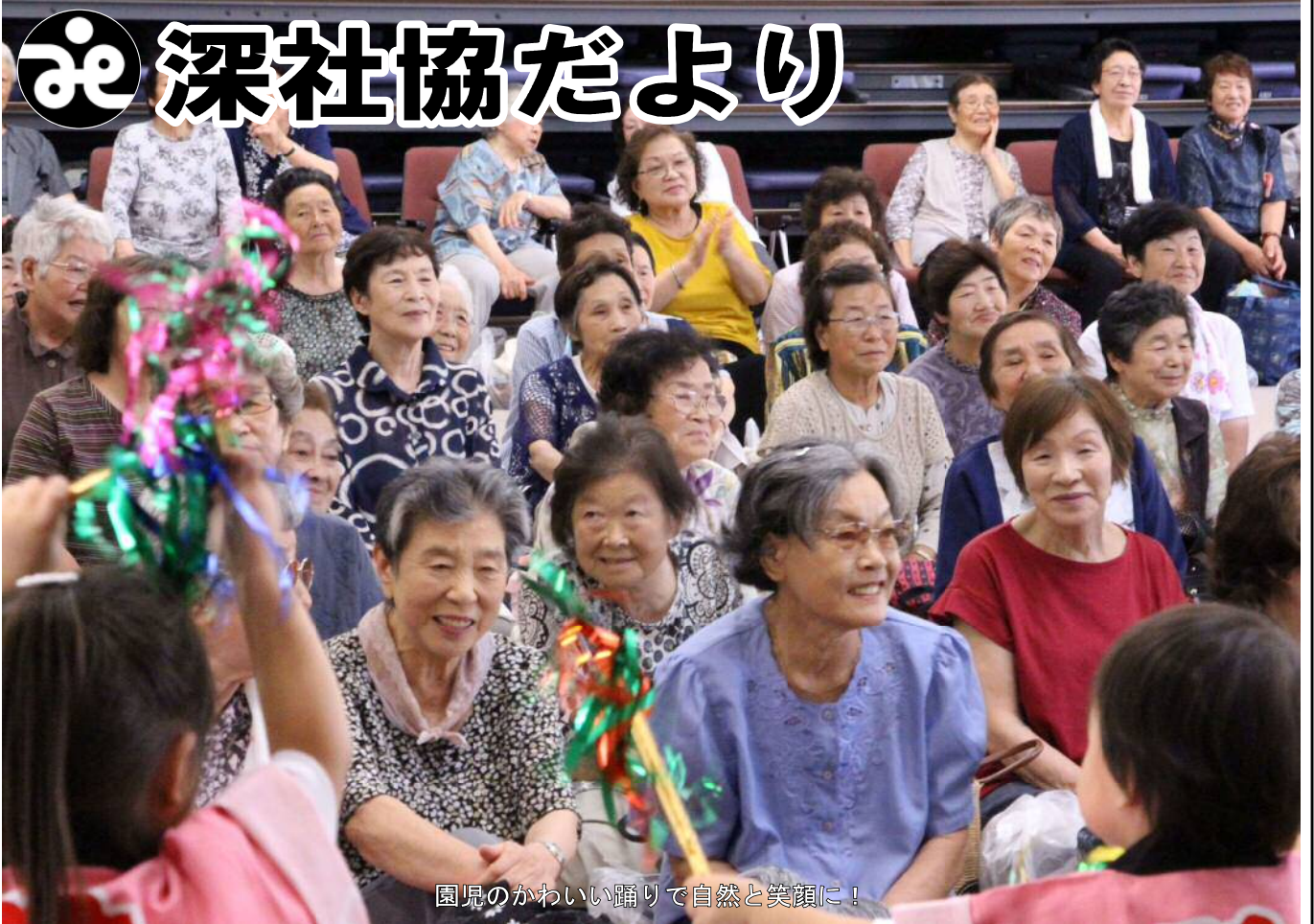
園児のかわいい踊りで自然と笑顔に！