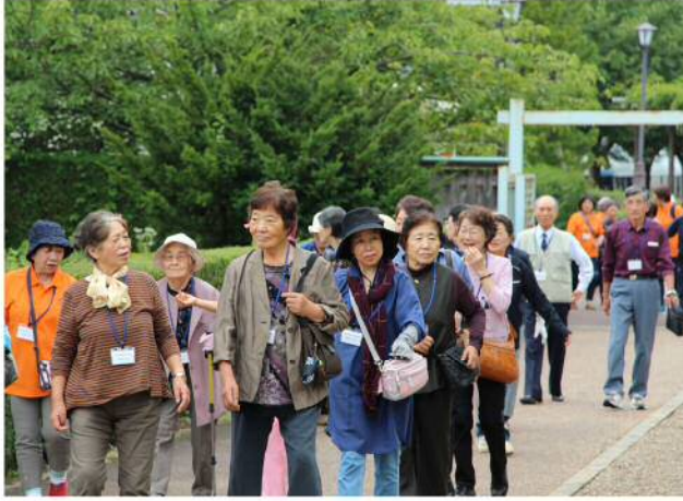
脳の健康教室は、火（ゆとり）、

水（ふれあいと創造の館）、金（ケアセンター） 曜日に開講していますので、興味がありましたら、ぜひ覗いてみてください。